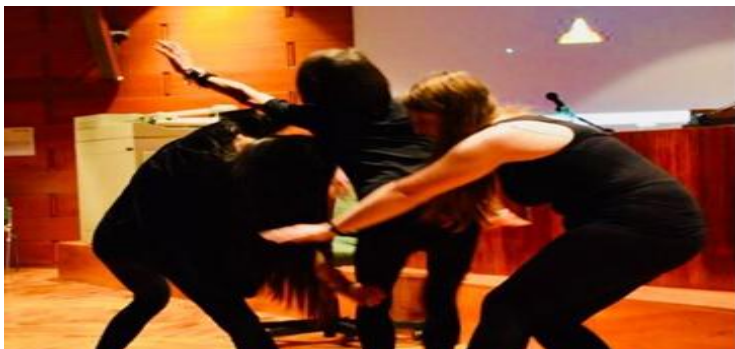
Spettacolo teatrale Metamorfosi 24/11/2017

Il valore terapeutico del TEATRO così come dell'Immagine (capacità simbolica) e della Scrittura (capacità riflessiva, tipica dell'adolescente), sta nella piena espressione di se stessi superando stereotipi e pregiudizi che, attraverso l'esplorazione guidata, favorisce l'armonica accettazione di sé o della propria storia personale che, spesso vengono rifiutati.